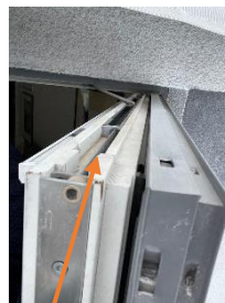
Spanjolett/Broms. Ihopkopplad med handtaget och möjliggör Låsning av dörren i öppet läge.