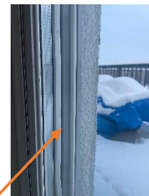
Tätningslister. Kan spricka av sol och värme och därmed försämrar tätningen.