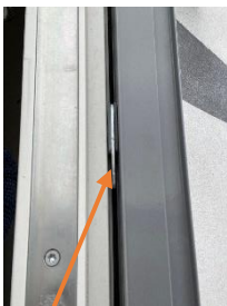
Balkongdörr. Koppelbeslag 3 st i metall kan gå isär och försämrar tätningen.