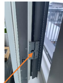
Trasigt koppelbeslag försämrar hopkoppling av fönster